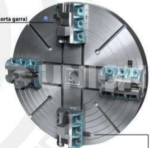
Trava de indexação do suporte

Suporte com castanha (garra/porta garra)